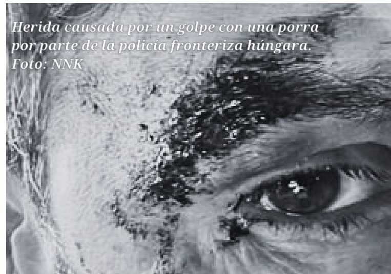
Herida causada por un golpe con una porra por parte de la policía fronteriza húngara.

análisis médico de las consecuencias físicas de la violencia fronteriza, para dar a nuestra audiencia la posibilidad de corroborar la veracidad de cada testimonio, según las conclusiones de profesionales de la salud con experiencia en las fronteras.